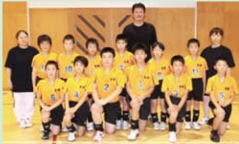
高砂スポ少男子バレーボールチーム