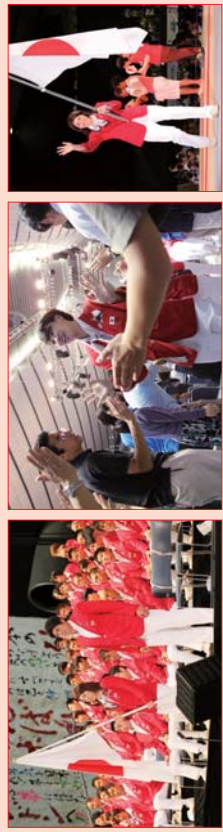
【参考】2012年ロンドンオリンピック応援イベントの様子

日本代表選手団約300名が参加。一般募集で集まった観客が選手団を送り出しました。