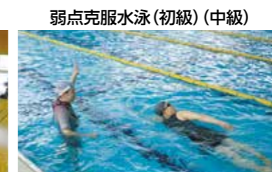
弱点克服水泳(初級)(中級)