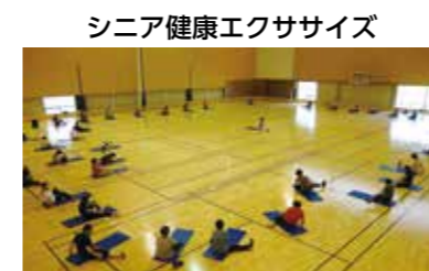
シニア健康エクササイズ

あなたにぴったりの教室がまだまだあります！ 各教室のご案内やイベント情報が盛りだくさん！