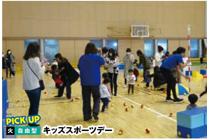
PICK UP 火 自由型 キッズスポーツデー