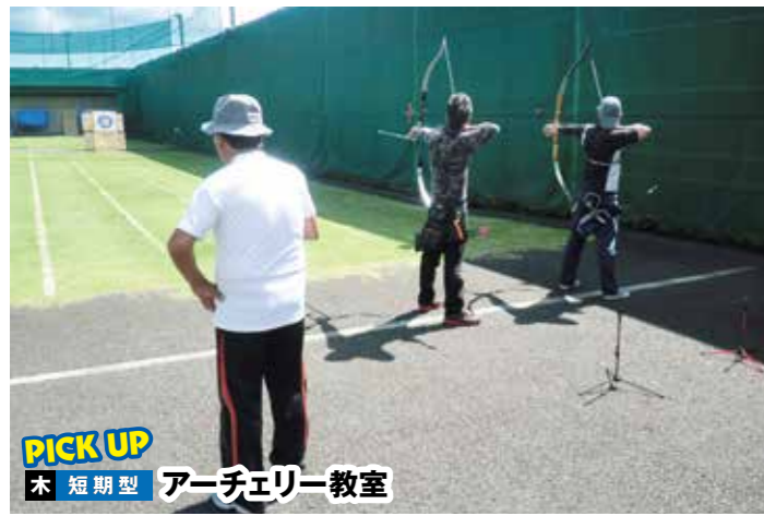
PICK UP 木 短期型 アーチェリー教室