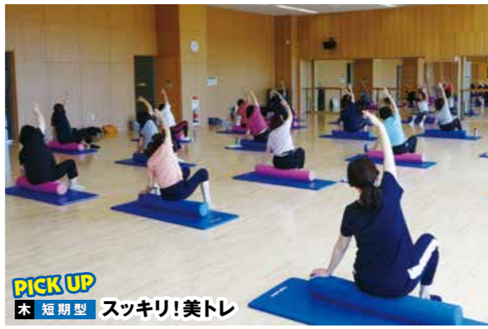
PICK UP 木 短期型 スッキリ!美トレ