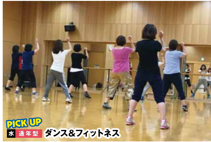
PICK UP 水 通年型 ダンス&フィットネス