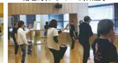
楊名時(ようめいじ)太極拳