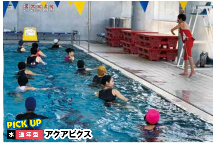
PICK UP 水 通年型 アクアピクス