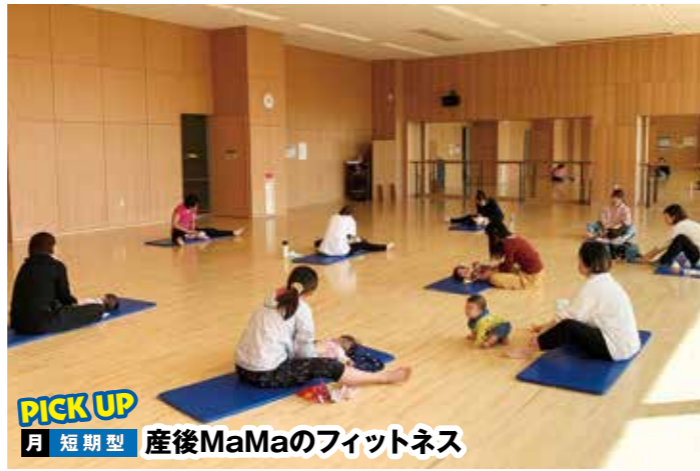
PICK UP 月 短期型 産後MaMaのフィットネス