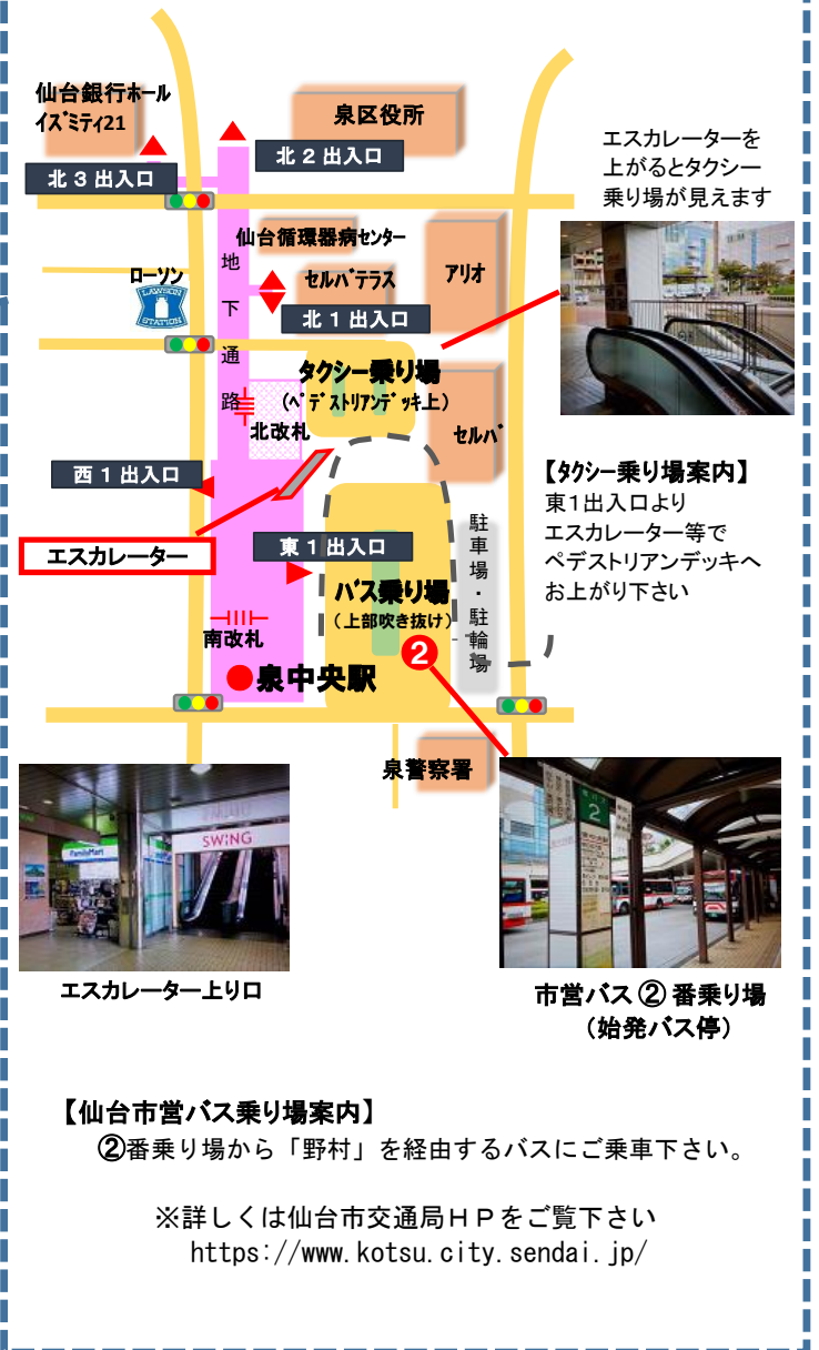
エスカレーター上り口