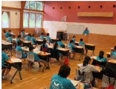
★講話 II (スポーツ少年団とは)