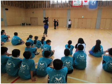
★ダンスデモンストレーション