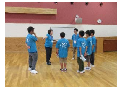
★リーダー打ち合わせ