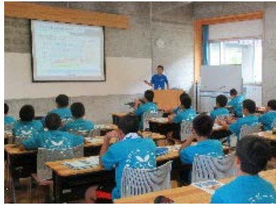
★大塚製薬講話(熱中症について)