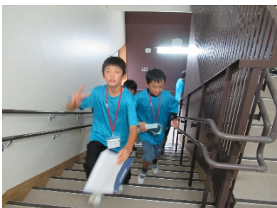
★館内オリエンテーリング