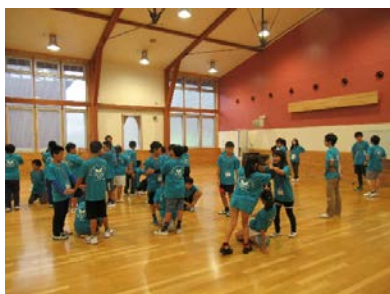
★リーダーによるゲーム