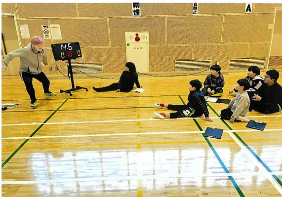
体力テストの一コマ

R 6 年度は沢山の団の皆様の参加をお待ちしています。（R 6 年度開催は、10月となります）